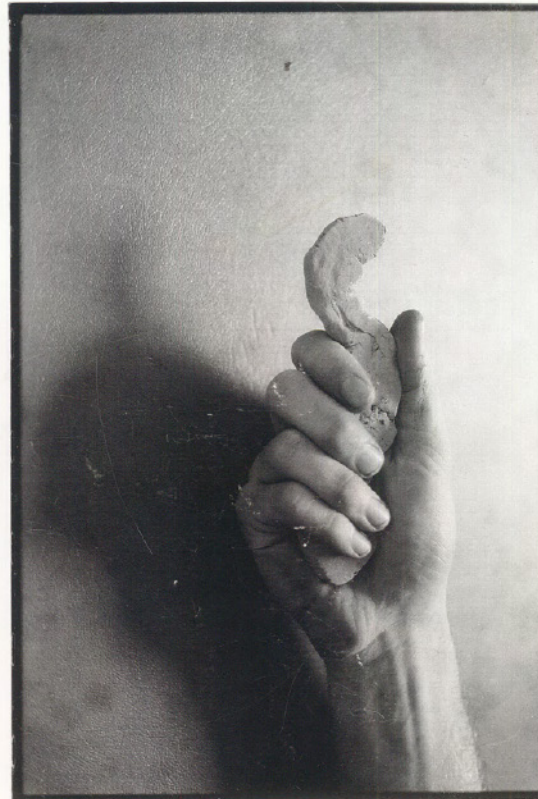
Markus Schwander, Ohne Titel, 1986