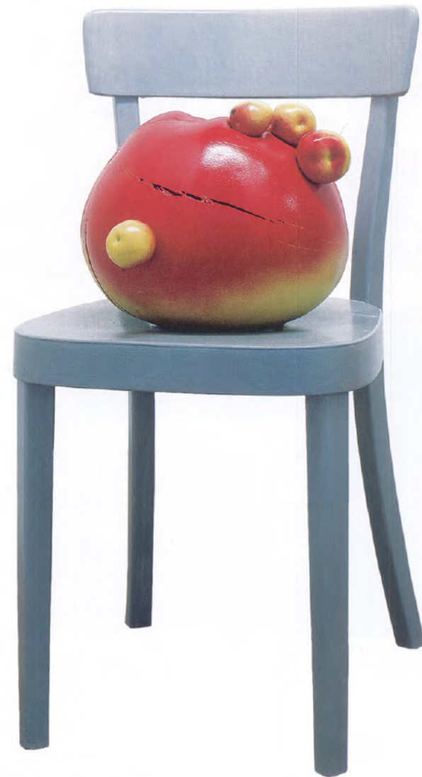
Die Verwandlung 1, 1998, S. Hasenböhler, Basel

Bei der Modellierung des Objektes und der aufwendigen Bearbeitung seiner Oberfläche kommt die Arbeit der