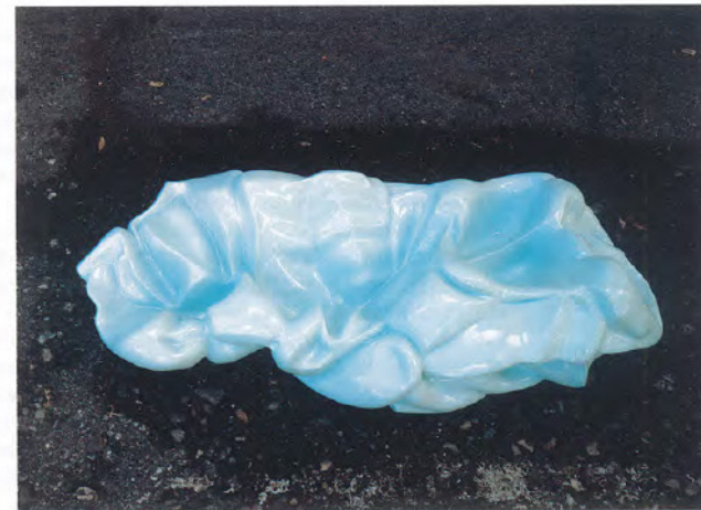
Untitled, chewed # 6, 2002, 82 x 40 x 20 cm, Kunststoff, Foto: Markus Schwander

die seit 2001 entstehenden Zeichnungen zentral. Für die inzwischen 60 Blätter umfassende Zeichnungsserie «Cézanne à Winterthur», seit 2003, verwendet Schwander eine eigens entwickelte Technik, welche die Zeichnung – entgegen ihrer gängigen Auffassung – als Medium des Indirekten versteht. In verschiedenen Museen hat Schwander Stilleben fotografiert. Um Schwarzweiss-Kontraste zu generieren, kopiert er die Fotografien, um sie dann mit einem Kugelschreiber und Kohlepauspapier auf das weisse Blatt zu übertragen. Die blauen Striche und Linienbündel sind weniger das Ergebnis zeichnerischer Unmittelbarkeit als vielmehr Spuren eines spezifischen Verfahrens, das sich an der Freilegung von Strukturen der Vorlage abarbeitet. Durch mehrmaliges Durchpausen, Übereinanderlegen und Verschieben einer Vorlage auf demselben Zeichnungspapier wird diese