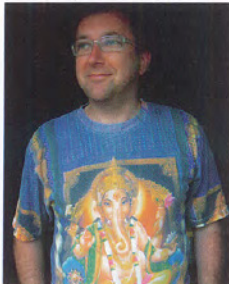
Markus Schwander (*1960) lebt und arbeitet in Basel.

Zu Markus Schwanders skulpturalen und zeichnerischen Arbeiten